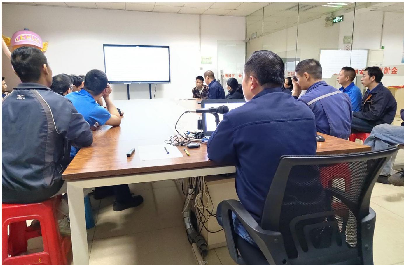
附件 2：培训及演练现场图片